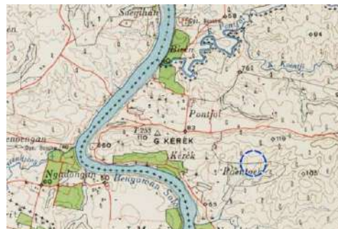
Gambar 1. Letak Desa Kerek Menurut Peta Ngawi Tahun 1926

Wilayah hutan yang luas ini tentunya banyak ditumbuhi tanaman yang memiliki nilai komoditas seperti tebu, nira, maupun aren. Ketiga komoditas ini ternyata dimanfaatkan oleh masyarakat untuk membuat minuman khas yang disebut Arak Jawa atau Arjo . Minuman khas ini tersebut dibuat oleh penduduk Desa Kerek, sebuah wilayah yang berada di pinggir Sungai Bengawan Solo, diapit bukit kapur, dan ditumbuhi pepohonan lebat.