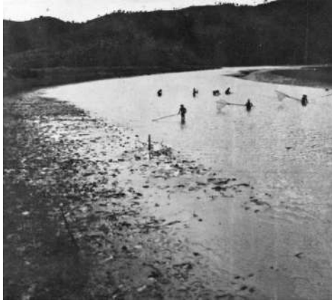
Gambar 2. Kegiatan Mencari Ikan di Sungai Bengawan Solo Tahun 1939

Mereka pergi melaut secara berkelompok dengan 5-6 perahu menuju ke Solo. Perjalanan biasanya melalui hutan jati dan memakan waktu 7-8 hari sehingga harus bermalam di sepanjang jalan. Biasanya perahu layar ini diawaki oleh dua orang, yaitu satu pendayung dan satu nelayan, sedangkan sisanya bertugas untuk melemparkan jalanya sambil berlayar. Adapun pendayung tentunya bertugas untuk menjaga keseimbangan perahu. Hasil tangkapan para nelayan Desa Kerek biasanya berupa ikan wagal, bader, tager, maupun papah yang kemudian dijual di Walikukun, Solo, maupun Sragen. Biasanya mereka akan kembali pulang setelah melaut selama 15 hari atau lebih. Hasil penjualan ini cukup untuk membeli nasi maupun kebutuhan rumah tangga (MvO, Cornelis: 21).